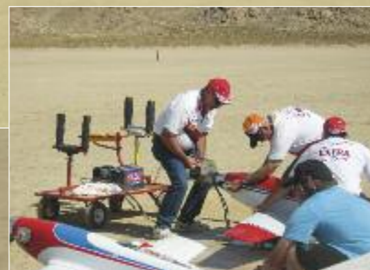
Start der Motoren: Gentlemen, you have a race!