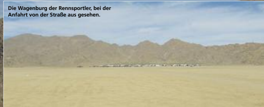
Die Wagenburg der Rennsportler, bei der Anfahrt von der Straße aus gesehen.